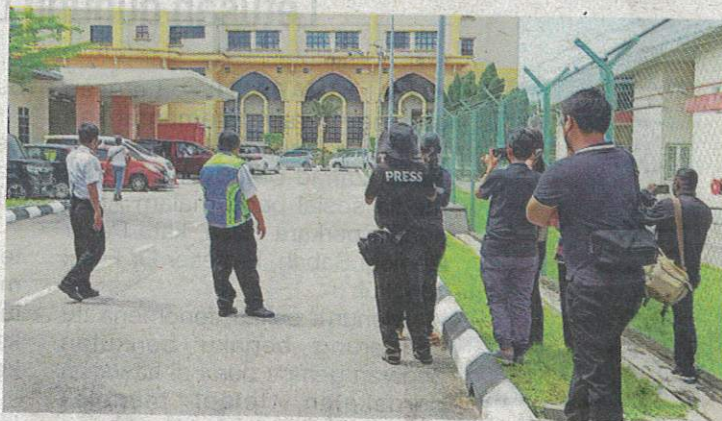
Petugas media dikawal pengawal keselamatan yang tidak dibenarkan menghampiri bangunan Jabatan Forensik, HRPB Ipoh.

Pasukan penyelamat berjaya membawa keluar mangsa dari kawasan hutan berkenaan pada Isnin lalu selepas 22 jam helikopter dilaporkan hilang.