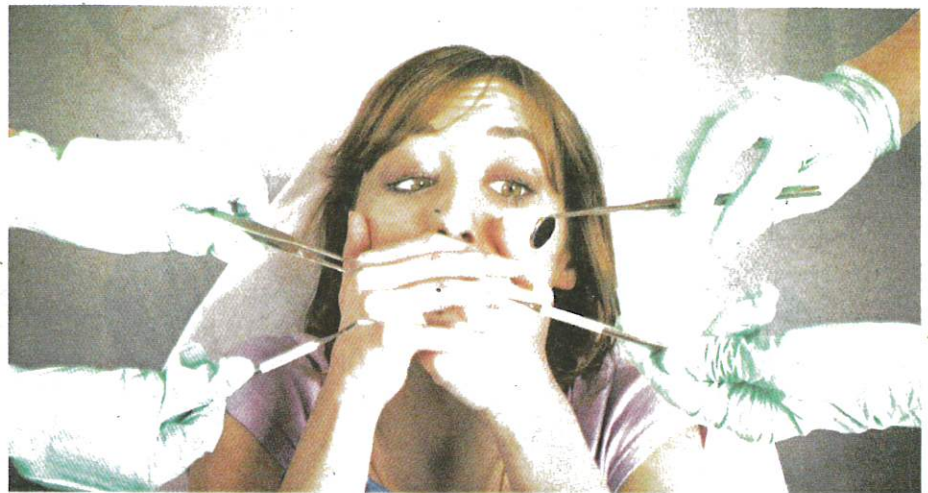
MASIH ramai yang takut dan gerun untuk berjumpa doktor gigi.

Sesetengah masyarakat mudah termakan umpan 'doktor gigi' haram