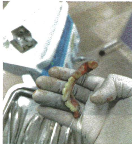
JANGAN ambil risiko mendapatkan rawatan pergigian daripada 'doktor gigi haram'.

kesan tetrasiklina yang berlaku apabila seorang ibu mengambil antibiotik tetrasiklina ketika hamil, menyusukan anak atau apabila kanak-kanak mengambilnya ketika gigi sekunder dan utama sedang tumbuh.