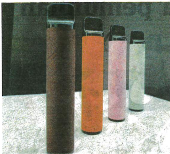
POD pakai buang kini ditawarkan pada harga serendah RM10 dan bebas dijual secara dalam talian termasuk di platform-platform terkemuka.