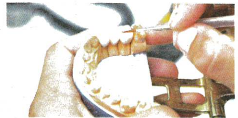
ACUAN gigi yang siap dipangkas dihasilkan dan ia dihantar ke makmal pergigian yang akan membuat jambatannya. - Gambar hiasan

"Dengan doktor gigi yang sah, venir jenis tidak langsung dibuat khas dan dihasilkan di makmal pergigian, manakala venir langsung memerlukan kerja tangan yang mahir kerana gigi perlu dibentuk serta